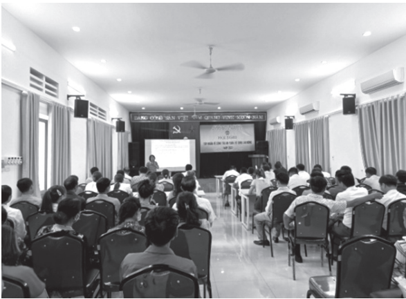
Hội Nông dân huyện Phú Xuyên phối hợp tổ chức hội nghị tập huấn về công tác an toàn vệ sinh lao động năm 2022

Các cấp Hội đã phối hợp tổ chức tuyên truyền các chủ trương của Đảng, chính sách pháp luật của nhà nước, Nghị quyết Hội Nông dân các cấp... cho trên 1.300 lượt cán bộ, hội viên nông dân. Vận động cán bộ, hội viên nông dân, các hộ sản xuất kinh doanh giỏi tham gia ủng hộ Quỹ “Vi biển, đảo Việt Nam” năm 2022 được tổng số tiền 60 triệu đồng. Vận động 135 cán bộ, hội viên nông dân tham gia hiến máu tình nguyện được 85 đơn vị máu.