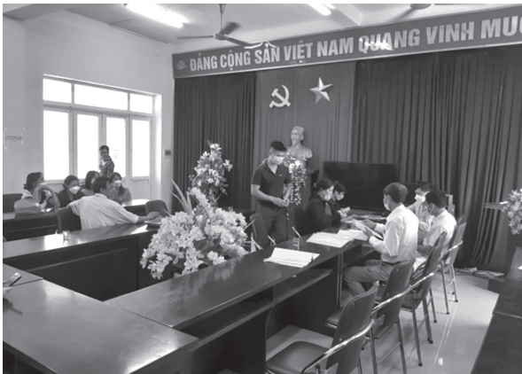
Hội Nông dân huyện Thanh Oai tổ chức giải ngân nguồn vốn Quỹ HTND

Tuyên truyền, vận động cán bộ, hội viên, nông dân tập trung chăm sóc lúa vụ xuân 2022. Duy trì tốt việc vệ sinh môi trường và chăm sóc tuyến đường hoa, đoạn đường tự quản vào sáng thứ bảy, chủ nhật hàng tuần.