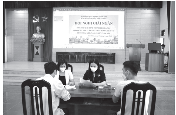
Hội Nông dân huyện Quốc Oai tổ chức giải ngân vốn Quỹ HTND

Các cấp Hội tổ chức tuyên truyền được 106 buổi trên hệ thống loa truyền thanh cho hội viên nông dân về, nuôi trồng thủy sản, kỹ thuật chăm sóc cây có múi; hướng dẫn cách sử dụng và bảo quản thuốc sinh học phòng trừ sâu bệnh cho cây trồng và rau an toàn.