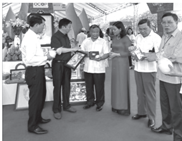
Đồng chí Đinh Khắc Đỉnh - Phó Chủ tịch Trung ương Hội Nông dân Việt Nam thăm quan gian hàng của thành phố Hà Nội tại Festival Trái cây

Từ ngày 28/5 đến 31/5/2022, Đoàn lãnh đạo và cán bộ Hội Nông dân Thành phố, Văn phòng Điều phối xây dựng nông thôn mới Thành phố tham dự chuỗi sự kiện Festival trái cây tại tỉnh Sơn La. Tham dự Festival trái cây tại tỉnh Sơn La, thành phố Hà Nội có 25 chủ thể với hàng 100 sản phẩm Ocop được trưng bày, giới thiệu tại Festival.