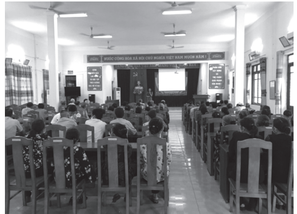
Hội Nông dân huyện Đan Phượng phối hợp tổ chức hội nghị tập huấn Luật hôn nhân gia đình tại xã Trung Châu. (Ảnh: Nguyễn Liên)

Phối hợp với Trung tâm Khuyến nông huyện tổ chức hội nghị trực tuyến “Diễn đàn khuyến nông Nhịp cầu nhà nông” giữa điểm cầu trung tâm và 04 điểm cầu tại các xã với 150 đại biểu tham dự. Tổ chức Hội nghị tọa đàm về hiệu quả sử dụng thuốc thảo mộc Anisaf tại xã Hạ Mỗ với 30 đại biểu.