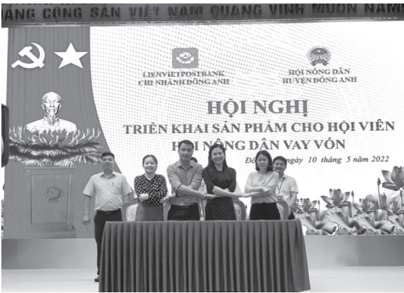
Hội Nông dân Huyện Đông Anh phối hợp với Ngân hàng TMCP Bưu Điện Liên Việt Chi nhánh Đông Anh tổ chức Hội nghị triển khai sản phẩm cho hội viên nông dân vay vốn

Phối hợp tổ chức 4 hội nghị tuyên truyền, tập huấn về chuyển giao khoa học kỹ thuật về trồng, chăm sóc cây ăn quả; về phòng, chống tai nạn lao động và bệnh nghề nghiệp; về Cuộc vận động Người Việt Nam ưu tiên dùng hàng Việt Nam; tuyên truyền phổ biến giáo dục pháp luật cho trên 600 cán bộ, hội viên tham dự.