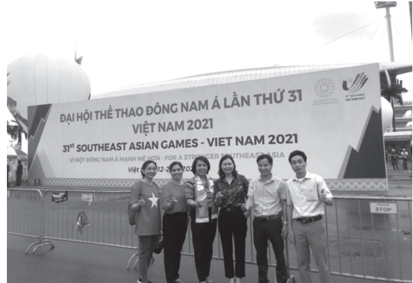
Các đồng chí lãnh đạo, cán bộ Hội Nông dân Thành phố tham gia Lễ khai mạc Seagame 31 tại Sân vận động Quốc gia Mỹ Đình

tích cực tham gia cổ vũ, động viên các vận động viên Việt Nam tham gia tranh tài ở các môn thể thao góp phần vào thành công Đại hội Thể thao Đông Nam Á lần thứ 31.