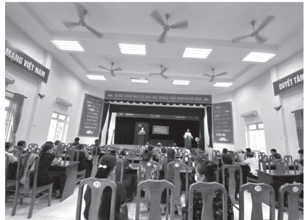
Hội Nông dân xã Văn Tự, huyện Thường Tín phối hợp tổ chức khai giảng lớp huấn luyện nông dân về SRI trên cây lúa

Chỉ đạo cơ sở Hội tổ chức các hoạt động tuyên truyền chào mừng ngày giải phóng miền Nam 30/4 và ngày quốc tế lao động 1/5, các hoạt động của Sea game 31 thông qua trang Fanpage, Zalo của Hội. Tổ chức Hội thi “Nhà nông đua tài” dưới nhiều hình thức đa dạng như: thi viết “Tìm hiểu kiến thức nhà nông”, sân khấu hóa, hái hoa dân chủ; kết quả đã có