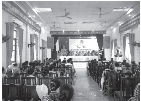
Hội Nông dân xã Hương Ngải, huyện Thạch Thất tổ chức Hội thi Nhà nông đua tài năm 2022

Vận động cán bộ, hội viên nông dân và nhân dân chủ động, thích ứng linh hoạt trong công tác phòng chống dịch Covid -19 để khôi phục kinh tế xã hội trong giai đoạn hiện nay. Tổ chức tuyên truyền cho trên 4.000 lượt hội viên tham gia cuộc vận động người Việt Nam ưu tiên dùng hàng Việt Nam, phòng chống tai nạn thương tích, về chính sách Dân số kế hoạch hóa gia đình, chuyển giao khoa học kỹ thuật, công tác phòng chống cứu nạn cứu hộ, phòng chống thiên tai.