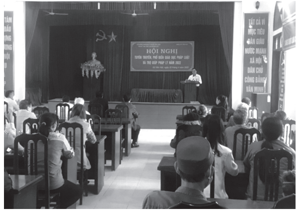
Hội Nông dân huyện Ứng Hòa tổ chức tuyên truyền, phổ biến giáo dục pháp luật tại xã Viên An

Phối hợp với Đảng ủy xã Hòa Nam chỉ đạo Hội Nông dân xã kiện toàn chức danh Chủ tịch Hội Nông dân xã nhiệm kỳ 2018-2023. Tổ chức rà soát và bổ sung quy hoạch chức danh cán bộ lãnh đạo, quản lý cơ quan Hội Nông dân huyện thuộc diện Ban Thường vụ Huyện ủy quản lý nhiệm kỳ 2018 -2023 và các nhiệm kỳ tiếp theo.