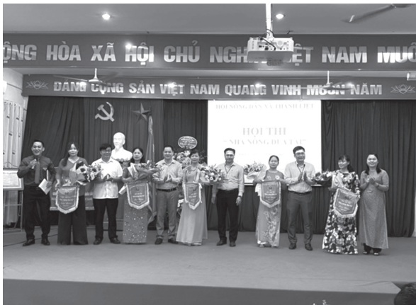
Hội Nông dân xã Thanh Liệt, huyện Thanh Trì tổ chức Hội thi Nhà nông đua tài năm 2022

Phối hợp với Đài truyền thanh phát 29 tin, bài tuyên truyền về hoạt động của các cấp Hội. Tổ chức 14 hội nghị với trên 1.650 lượt cán bộ, hội viên nông dân tham gia thực hiện các biện pháp phòng, chống dịch bệnh, công tác vệ sinh an toàn thực phẩm và chăm sóc sức khỏe nhân dân; 12 hội nghị tập huấn về kỹ thuật trồng lúa, rau vụ hè cho 1.600 cán bộ, hội viên.