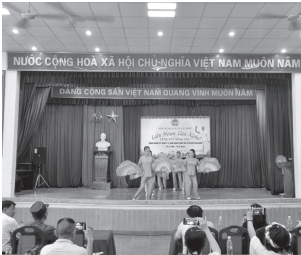
Hội Nông dân xã Văn Khê, huyện Mê Linh tổ chức Liên hoan văn nghệ “Tiếng hát nông dân”

Tổ chức hội nghị đối thoại giữa Thường trực huyện uỷ với hội viên nông dân huyện Mê Linh với 200 đại biểu là các doanh nghiệp sản xuất trong lĩnh vực nông nghiệp, các hợp tác xã và 150 hộ sản xuất giỏi trên địa bàn xã, thị trấn.