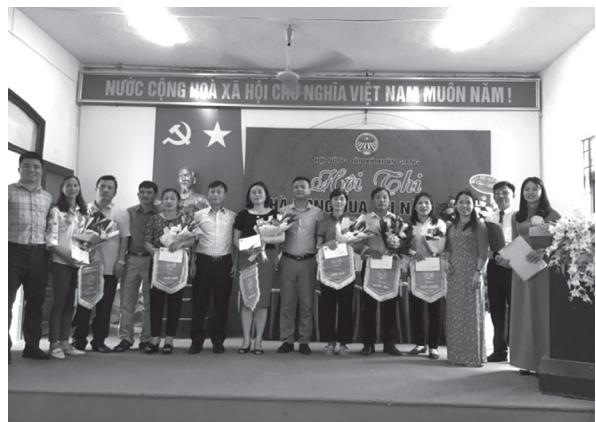
Hội Nông dân xã Xuân Giang, huyện Sóc Sơn tổ chức Hội thi Nhà nông đua tài năm 2022

Các cấp hội đã phối hợp tuyên truyền đến 21.300 cán bộ, hội viên nông dân thực hiện tốt các Chỉ thị, Nghị quyết của Đảng, chính sách pháp luật của Nhà Nước. Tổ chức quán triệt và triển khai thực hiện kết luận số 21 - KL/TW hội nghị lần thứ tư Ban Chấp hành Trung ương Đảng (Khóa XIII) về đẩy mạnh xây dựng chính quyền Đảng và hệ thống chính trị, kiên quyết ngăn chặn, đẩy lùi, xử lý nghiêm cán bộ, đảng viên suy thoái về tư tưởng chính trị, đạo đức, lối sống, biểu hiện “Tự diễn biến”, “Tự chuyển hóa” cho 580 cán bộ, hội viên nông dân.