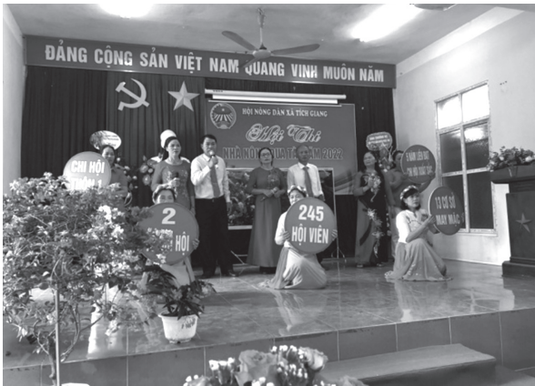
Hội Nông dân xã Tích Giang, huyện Phúc Thọ tổ chức Hội thi Nhà nông đua tài năm 2022

Chỉ đạo kiện toàn chức danh Chủ tịch Hội Nông dân cơ sở theo đúng quy định của Điều lệ Hội. Phối hợp tổ chức lớp tập huấn nghiệp vụ công tác Hội cho 224 đồng chí cán bộ Hội Nông dân huyện và cơ sở. Thành lập 01 chi hội nghề nghiệp với 15 thành viên tham gia.