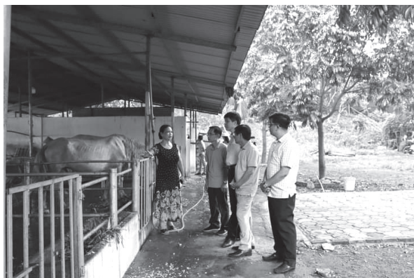
Các đồng chí lãnh đạo Hội Nông dân thành phố Hà Nội và Hội Nông dân tỉnh Quảng Trị thăm mô hình nuôi ngựa bạch tại xã Yên Mỹ, huyện Thanh Trì

công tác tuyên truyền đảm bảo trật tự an toàn giao thông, công tác đảm bảo trật tự đô thị, vệ sinh môi trường trên địa bàn Thành phố; Về công tác đấu tranh phòng chống tham nhũng, lãng phí... Những vấn đề khác được dự luận quan tâm.