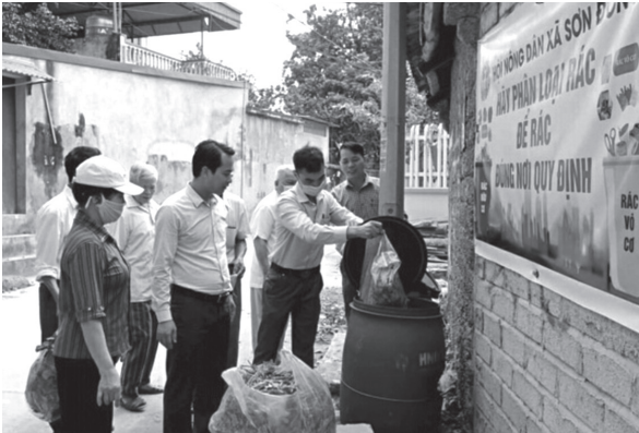
Hội Nông dân thị xã Sơn Tây ra mắt mô hình điểm bảo vệ môi trường thu gom, phân loại rác thải xử lý thành phân bón hữu cơ tại xã Sơn Đông

Các cấp Hội Nông dân thị xã tuyên truyền cho trên 1.500 lượt cán bộ, hội viên nông dân về các chỉ thị, nghị quyết của Đảng, chính sách pháp. Đăng tải 10 tin, bài tuyên truyền các hoạt động của Hội trên Đài truyền thanh các xã, phường, trên trang Fanpage, Zalo của Hội. Vận động cán bộ, hội viên nông dân tham gia ủng hộ quỹ “Vì biển đảo Việt Nam”.