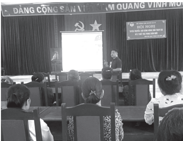
Hội Nông dân huyện Ba Vì phối hợp với Phòng Tài nguyên môi trường triển khai Đề án bảo vệ môi trường tại xã Minh Châu

Phối hợp tổ chức 5 hội nghị tuyên truyền, tập huấn về cuộc vận động người Việt Nam dùng hàng Việt Nam; tập huấn công nghệ 4.0 trong phát triển nông nghiệp; tập huấn phát triển kinh tế tập thể, tổ hợp tác, hợp tác xã; tuyên truyền về bảo vệ môi trường cho 350 hội viên. Phối hợp tổ chức hội nghị tọa đàm “Nâng cao vai trò của nông dân tham gia xây dựng huyện nông thôn mới” với 70 đại biểu tham dự; tổ chức hội nghị tập huấn nghiệp vụ công tác tổ chức, kiểm tra công tác quản lý nguồn Quỹ HTND, công tác tuyên truyền cho 195 cán bộ huyện, Hội và cơ sở. Tổ chức được 26 lớp tập huấn về kỹ thuật nuôi trồng thủy sản và chăm sóc cây ăn quả; Kỹ thuật sử dụng thuốc bảo vệ thực vật, bón phân sinh học A2...cho 1.690 lượt người tham dự. Chỉ đạo thành lập mới được 2 tổ hội nghề nghiệp gắn với tổ hợp tác tại xã Phong Vân và Phú Đông; xây dựng 5 dự án nguồn vốn quay vòng của Thành phố với số tiền 2,1 tỷ đồng. Tổ chức hội nghị họp Ban Chấp hành mở rộng thực hiện công tác quy hoạch cán bộ hội nhiệm kỳ 2023 – 2028; kiện toàn 01 đồng chí UV BTV, 01 đồng chí UV BCH Hội Nông dân huyện nhiệm kỳ 2018 – 2023.