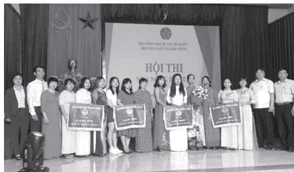
Hội Nông dân xã Kim Chung, huyện Hoài Đức tổ chức Hội thi nhà nông đua tài năm 2022

Phối hợp với phòng Kinh tế huyện tổ chức 06 hội nghị tập huấn cho trên 730 cán bộ, hội viên nông dân, trong đó có 04 hội nghị tập huấn về công tác an toàn thực phẩm trong sản xuất nông nghiệp tại xã Tiên Yên, Di Trạch, Sơn Đồng, Song Phượng và 02 hội nghị tập huấn bảo vệ quyền lợi người tiêu dùng tại xã Yên Sở và Đông La.