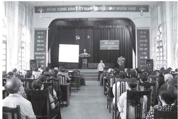
Hội Nông dân huyện Chương Mỹ phối hợp tổ chức tuyên truyền, phổ biến giáo dục pháp luật về bảo đảm trật tự an toàn giao thông và văn hóa giao thông năm 2022 (Ảnh: Minh Thúc)

Phối hợp tổ chức 07 hội nghị tuyên truyền về đảm bảo an toàn, vệ sinh lao động, phòng chống tai nạn thương tích; tuyên truyền cuộc vận động người Việt Nam ưu tiên dùng hàng Việt Nam, tuyên truyền an toàn giao thông, tư vấn pháp luật cho 780 hội viên.