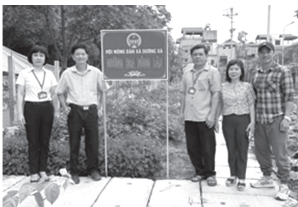
Hội Nông dân xã Dương Xá, huyện Gia Lâm tổ chức gắn biển Đường hoa Nông dân

Phối hợp tổ chức 3 hội nghị tuyên truyền pháp luật về đất đai, công tác cấp giấy phép xây dựng trên địa bàn huyện; tuyên truyền phòng chống mua bán người. Tổ chức 17 buổi tuyên truyền, tập huấn kỹ thuật sản xuất nông nghiệp, cây ăn quả, hoa cây cảnh... cho 1.445 lượt hội viên nông dân. Phối hợp với Trạm bảo vệ thực vật huyện tổ chức 02 lớp IPM cho hội viên về phát triển cây hoa cắt cành đảm bảo theo hướng hữu cơ. Hội Nông dân xã Đặng Xá tổ chức thăm quan mô hình kinh tế tại huyện Mộc Châu, tỉnh Sơn La.