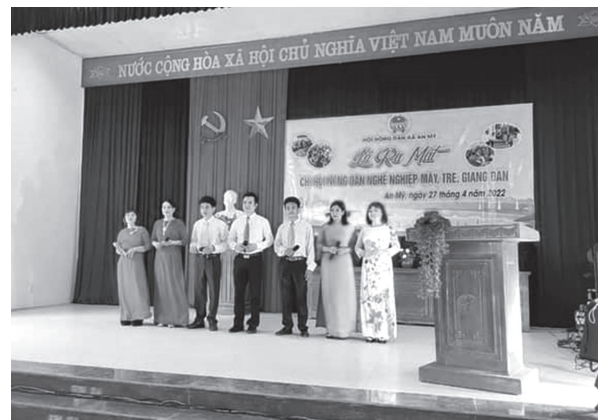
Hội Nông dân xã An Mỹ, huyện Mỹ Đức tổ chức Lễ ra mắt Chi hội Nông dân nghề nghiệp Mây, tre, giang đàn

Tổ chức 15 buổi tuyên truyền các Chỉ thị, Nghị quyết của Đảng, chính sách, pháp luật của Nhà nước về xây dựng nông thôn mới; các chính sách pháp luật trong lĩnh vực “Nông nghiệp- nông dân – nông thôn”. Phối hợp với Đài truyền thanh huyện, xã viết được 17 tin bài tuyên truyền về hoạt động công tác Hội và phong trào nông dân.